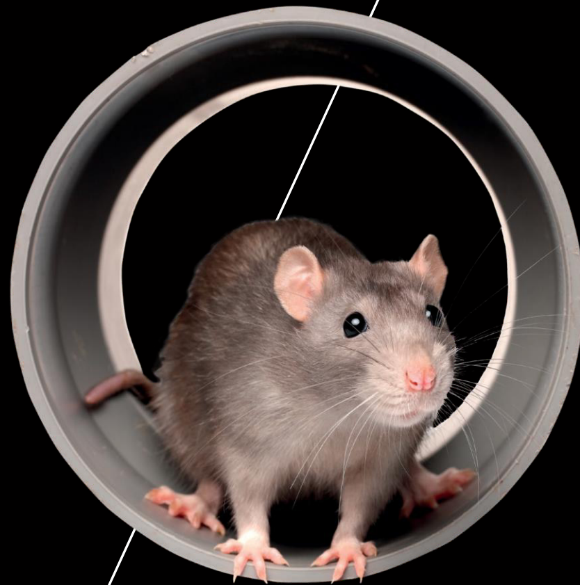
Thiim-sperre – et sikkert valg

Thiims rottesperre er konstruert med et dobbelt spjeld som låses innbyrdes ved hjelp av et patentanmeldt låsesystem. Det gjør at spillvannet kan passere uhindret i avløpsretningen, men at rottene ikke kan bevege seg forbi i motsatt retning. Sperrene er fremstilt i rustfritt stål og kan monteres i alle typer rør og materialer.